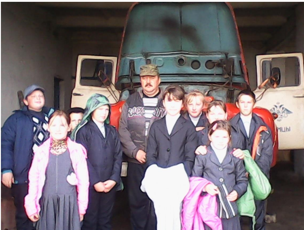
4. Викторина «Безопасность и защита человека в ЧС» с показом презентации