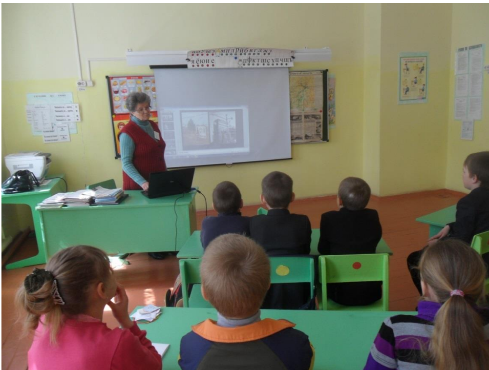
3. Экскурсия в пожарную часть села Семцы (4 класс)